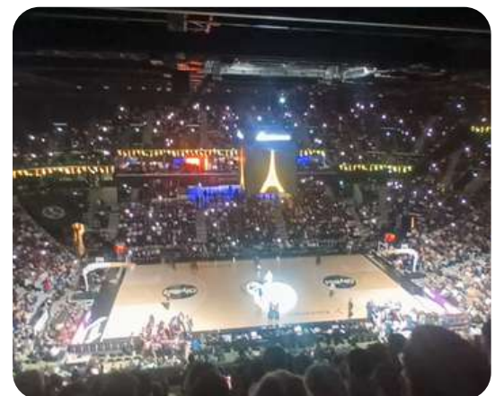
Grégory du club de Sport Adapté Choisy le Roi présent lors du match Paris Basketball / Anadolu Efes Istanbul du 28 octobre